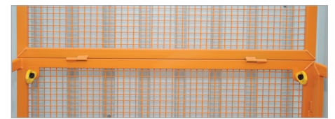
Anschlagpunkte für PSA (Persönliche Schutzausrüstung)