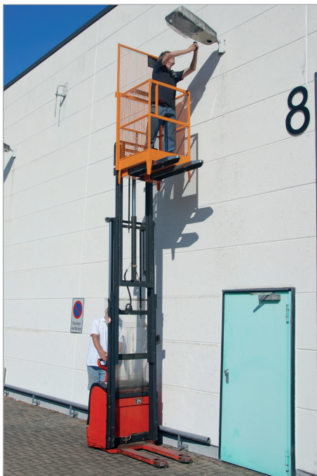
MB-I am Deichselstapler