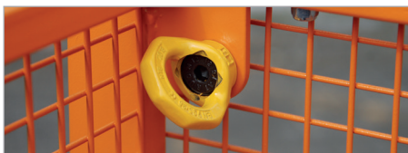
Anschlagpunkt für PSA (Persönliche Schutzausrüstung)