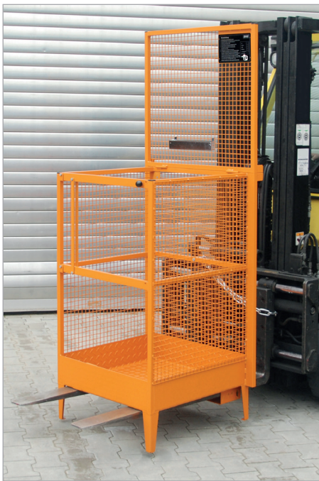
MB-I mit Kettensicherung am Gabelstapler

Die Arbeitsbühne für Deichselstapler und Gabelstapler. Bietet Sicherheit bei Reparatur- und Wartungsarbeiten in der Höhe