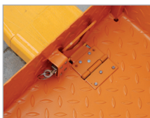
Sicherung am Deichselstapler