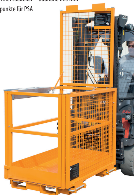
MB-II zur Längsaufnahme