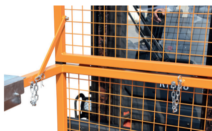
Sicherungen der abklappbaren Schutzgitter