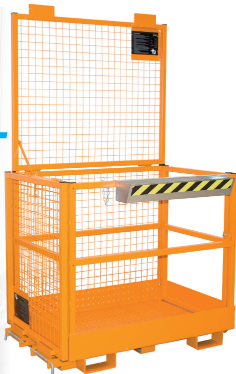
MB-II zur Queraufnahme

ab € 860,- frei Haus gültig bis 31.12.2018