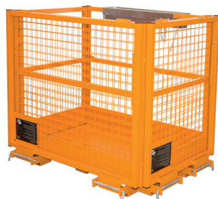
Platzsparende Lagerung durch beidseitig zurückgeklappte Schutzgitter