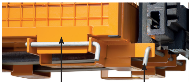
Einfahrtschutz an den nicht verwendeten Einfahrtaschen